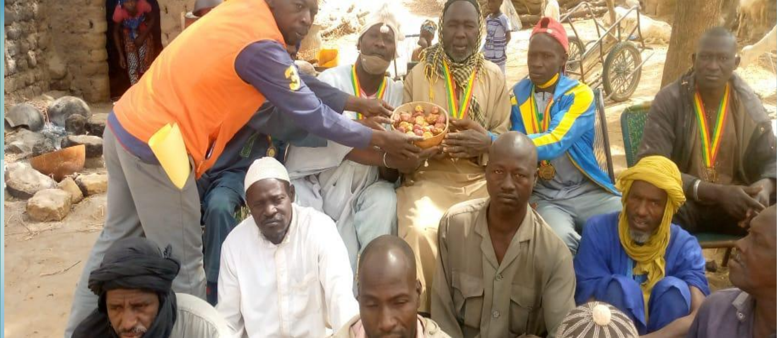
Rencontres des parties en conflit (Dogon/ Peulh à Madougou)