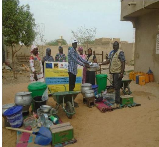
Remise de kits culinaires au GSN

La mise œuvre du programme est assuré par 17 dix-sept (17) organisations à travers quatre cosortia a savoir Action contre la faim, International Rescue Committee, Save the children, Humanité & Inclusion. Et une cellule de coordination dénommé inter consortia.