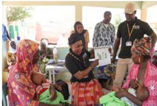
Causerie éducative sur la nutrition à Douentza

qui permet de surmonter ces difficultés et ainsi d'assurer un dépistage continu des enfants. Pour aller plus loin dans la prévention de la malnutrition au niveau communautaire, IRC a aussi mis en place 20 groupes de