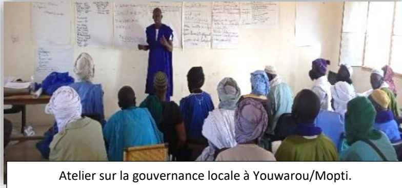
Atelier sur la gouvernance locale à Youwarou/Mopti.

dont 19 femmes et 07 personnes en situation de handicap constitué de membres des CGC, CP, les élus, représentants des services techniques et organisations de la société civile.