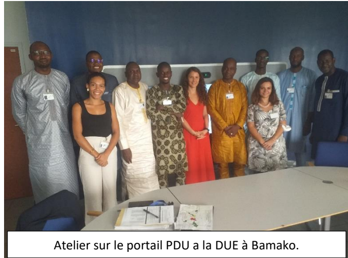
Atelier sur le portail PDU a la DUE à Bamako.

Selon la DUE la conception de de cette plateforme de l'inter consortia vient a nommé, car le programme PDU est jusque-là confronté a un défis majeur relatif à l'harmonisation des outils de suivi et évaluation, a la collecte et au traitement des données exploitables.