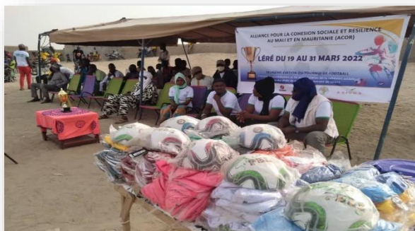
Tournoi de football à Léré (Tombouctou)

Dans le cadre de la promotion de la paix et de la cohabitation pacifique, les membres du réseau CP de Léré ont organisé leur 2e édition du tournoi de football qui s'est déroulé du 19 au 31 mars 2022 au niveau du chef-lieu de la commune. Cette activité a mobilisé toutes les couches sociales de la commune,