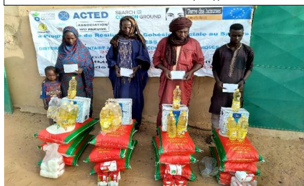
Distribution alimentaire à N'tillit/ région deGao

Ces assistances alimentaires ont particulièrement permis aux ménages très pauvres ciblés de subvenir à leurs besoins de base durant les périodes extrêmement critiques de soudure et également permis aux 300 ménages très pauvres de préserver leurs moyens d'existence et leur éviter de recourir à des pratiques néfastes de survie.