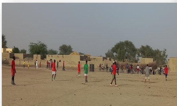
Foot ball à Léré pour booster la cohésion sociale.

avec la participation de 11 équipes. Ce tournoi a mobilisé environ 585 personnes dont 515 jeunes hommes et 185 filles soit 88 % et 11 personnes en situation de handicap.