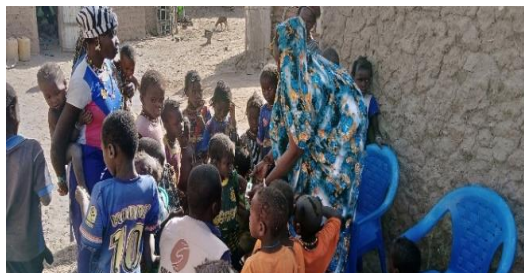
Dépistage de masse des enfants malnutri à Nampalari/Segou.