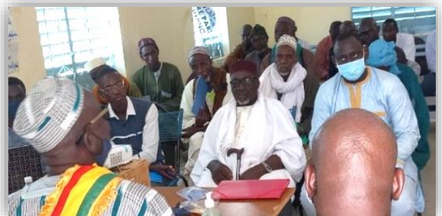
Atelier sur la gouvernance locale à Youwarou /Mopti.

Le trimestre a été marqué par l'organisation d'un atelier sur la gouvernance locale dans les trois communes d'intervention. L'objectif visé par cet atelier était de renforcer les capacités des acteurs locaux en matière de gouvernance locale sur les thèmes résolution de conflits, négociation et le plaidoyer. Ces ateliers se sont déroulés respectivement les 21 et 22 février